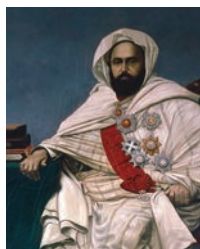
Emir ABD EL-KADER